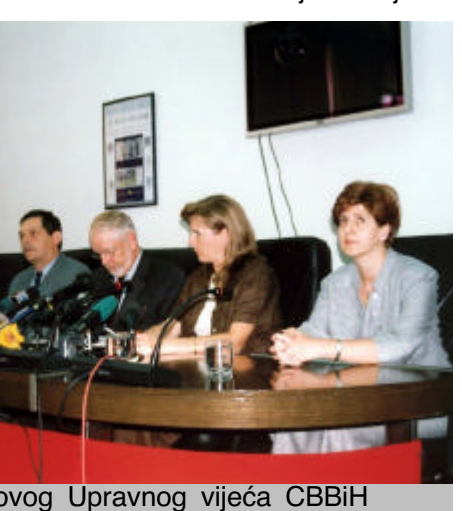
Članovi novog Upravnog vijeća CBBiH

ocijenjene su kao izuzetno značajne u historiji CBBiH. Naime, prema Zakonu o CBBiH, guverner u prvih šest godina funkcioniranja CBBiH nije mogao biti državljanin BiH. Od 11. augusta/kolovoza, članovi Upravnog vijeća CBBiH moraju biti bh. državljanini, te je uslov da Nicholl ostane na ovoj funkciji bio