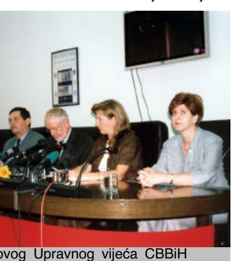
Članovi novog Upravnog vijeća CBBiH

ocijenjene su kao izuzetno značajne u historiji CBBiH. Naime, prema Zakonu o CBBiH, guverner u prvih šest godina funkcioniranja CBBiH nije mogao biti državljanin BiH. Od 11. augusta/kolovoza, članovi Upravnog vijeća CBBiH moraju biti bh. državljanini, te je uslov da Nicholl ostane na ovoj funkciji bio