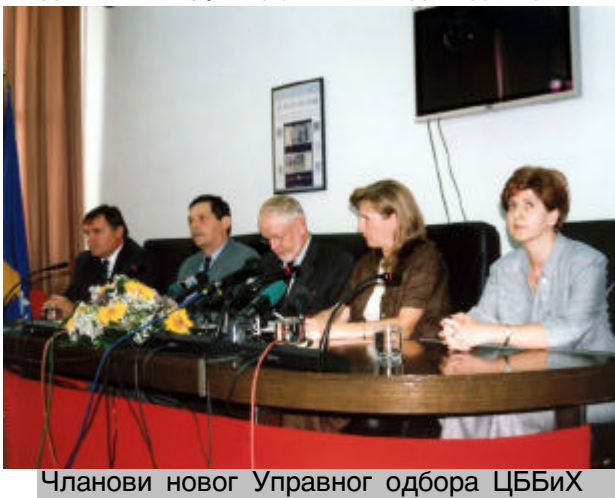
Чланови новог Управног одбора ЦББиХ

гувернера, оцијењене су као изузетно значајне у историји ЦББиХ. Наиме, према Закону о ЦББиХ, гувернер у првих шест година функционисања ЦББиХ није могао бити држављанин БиХ. Од 11. августа, чланови Управног одбора ЦББиХ морају бити бх. држављани, те је услов да Nicholl остане на овој функцији био да добије бх.