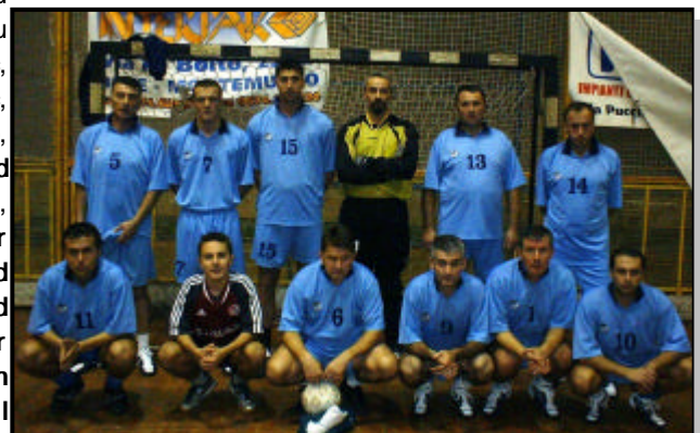
Tim CBBiH koji je osvojio turnir u Pratu

Na malonogometnom turniru učestvovalo je ukupno šest ekipa. Osim ekipa CBBiH i Kantona Sarajevo, takmičile su se i italijanske ekipe Sant. Andrea, Real Casale, Pama, te ekipa organizatora turnira SAR-PRA. Čestitke ekipi CBBiH na uspjehu!