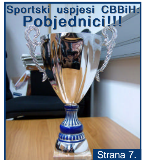
Sportski uspjesi CBBiH: Pobjednici!!!