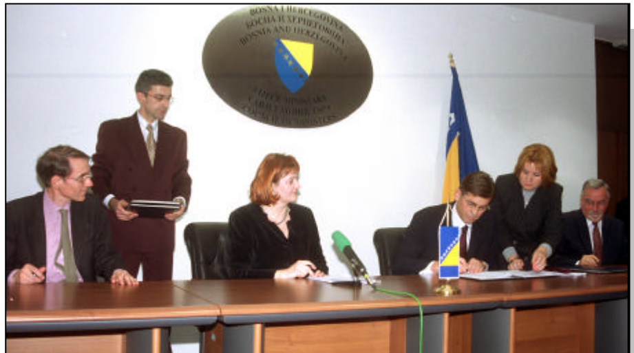
Detalj sa potpisivanja

vrijednosti. Razvojna banka Vijeća Evrope ima 35 zemalja članica, uključujući Sloveniju, koja se pridružila 1994. godine, te Hrvatsku