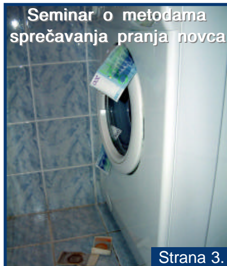
Seminar o metodama sprečavanja pranja novca