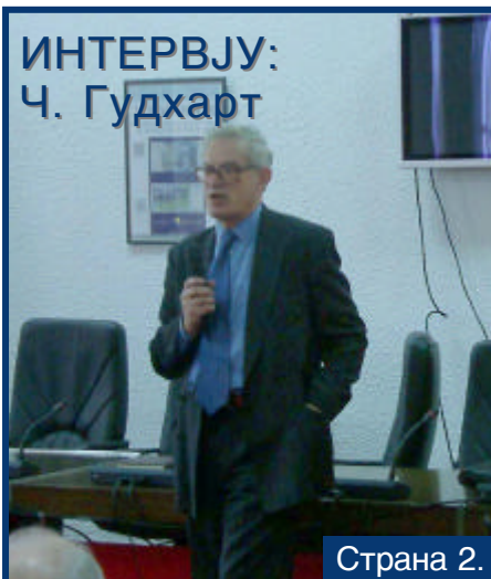
ИНТЕРВЈУ: Ч. Гудхарт

показује да би ЦББиХ и у наредној години могла остварити значајан профит. Постоји претпоставка да ће европске каматне стопе расти и да би, између осталог и по том основу, ЦББиХ могла остварити приход.