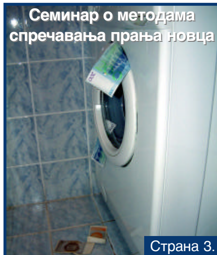
Семинар о методама спречавања прања новца