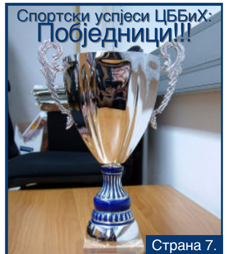
Спортски успјеси ЦББиХ: Побједници!!!