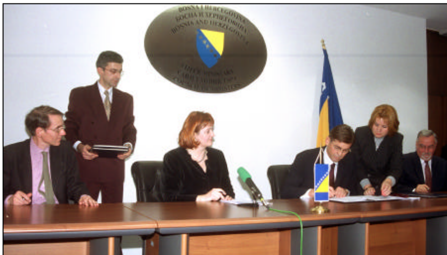
Детаљ са потписивања

вриједности. Развојна банка Савјета Европе има 35 земаља чланица, укључујући Словенију, која се придружила 1994. године,