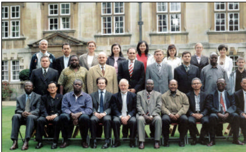
Zajednička fotografija učesnika seminara

rezervama. U skladu sa Smjernicama, postoje tri različita nivoa koji imaju različite odgovornosti u upravljanju rezervama: Upravno vijeće CBBiH, Investicioni komitet CBBiH i Odjeljenje za bankarstvo. CBBiH je bila prilično oprezna u