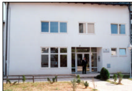
Nova zgrada Filijale Pale

Filijala Glavne banke Republike Srpske (GBRS) Pale realizirala je sve predviđene aktivnosti za septembar/rujan. Tokom svih devet mjeseci ostvareno je povećanje pozitivnog salda kupoprodaje KM-a na nivou Filijale, a u septembru/rujnu saldo je bio za 2,2 posto veći u odnosu na august/kolovoz. Saldo računa rezervi banaka koje vodi Filijala Pale povećan je za 2,5 posto u odnosu na prethodni mjesec. U septembru/rujnu broj transakcija prodaje KM bankama povećan je za 11,9 posto u odnosu na isti period prethodnog mjeseca, dok je broj transakcija kupovine KM smanjen za 11,1 posto u odnosu na isti period prethodne godine.