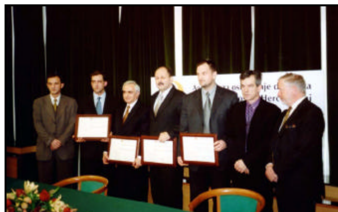
Devetnaest banaka članica programa osiguranja depozita

menom bankarstvu. Novi proizvodi i međunarodni standardi sve više su