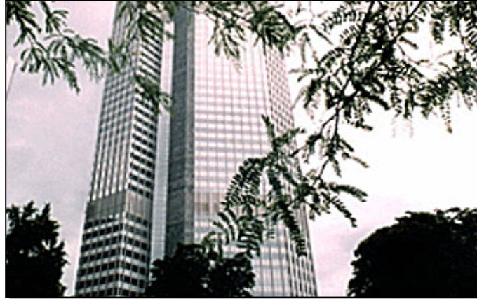
ECB: Kamatna stopa ostaje ista i u 2004. godini

radne snage, povećale na 1,75 posto u drugoj polovini godine. Za narednu godinu, ECB procjenjuje da će se inflacija kretati u rasponu od 1,3 do 2,3