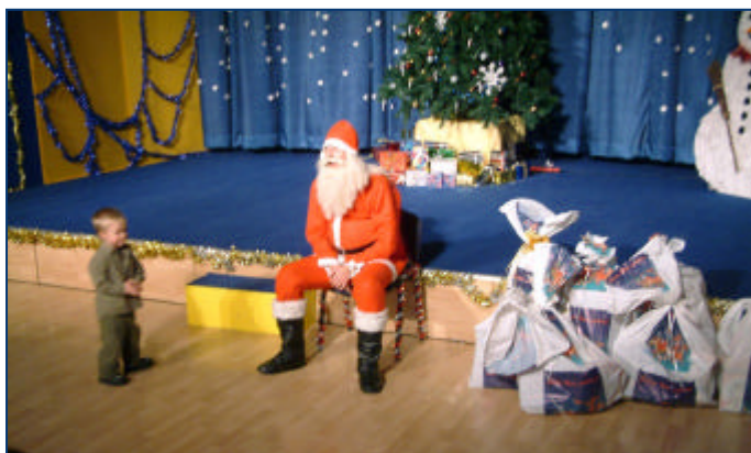
Подјела новогодишњих пакетића дјечи запослених у ЦББиХ - Сарајево, 26.12.2003.