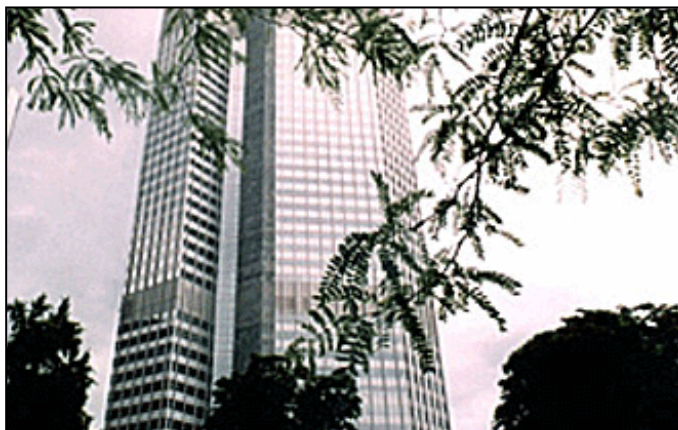
ЕЦБ: Каматна стопа остаје иста и у 2004. години

посто, а за 2005. годину између 1 и 2,2 посто. Очекивани економски раст слjedeће године би требало да се креће од 1,1 до 2,1 посто, а у