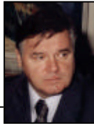
Пише: Вицегувернер ЦББиХ Кемал Козарић

Супервизија, односно надзор над пословањем банака, у савремено доба заокупља посебну пажњу домаће и међународне јавности. Промјене у окружењу наводе на нови приступ у начину провођења и уређења савремене банкарске супервизије. Глобализација економије и либерализација финансијских трансакција, технолошке иновације и нови финансијски производи и актери (електронско банкарство, велики финансијски кон-